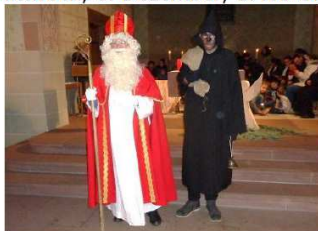
Nikolausbesuch für die Kinder

Freitag, 8. Dezember, 19.00 Uhr Maria Empfängnis, Eucharistiefeier